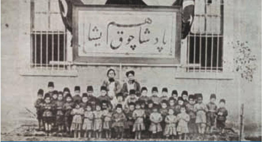
Dârülaceze Yetimhanesinde Çocuklar. Çocukların üzerindeki levhada “Padişahım çok yaşa” yazılıdır. (KAYNAK: Ehâsin-i Müessesât-ı Hayriye-i Hilafetpenahiden Dârülaceze, Mihran Matbaası, İstanbul 1324)